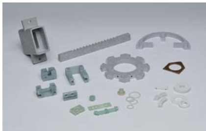
ガラエポ シリコンガラス ロスナボード その他 熱硬化性樹脂加工例