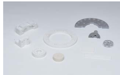
各種マシンブル セラミックス加工例