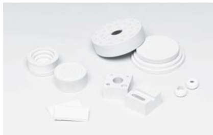
マイカレックス MM600加工例