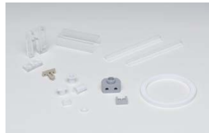
テフロン POM アクリル ナイロン PP その他 熱可塑性樹脂加工例

金属加工 SUS、アルミ、銅、真鍮 その他 精密機械加工。溶接、ろう付け、塗装、メッキ処理もご相談下さい。