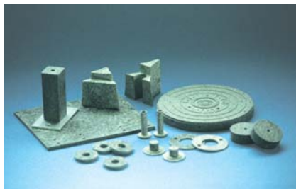
TCボード(不飽和ポリエステル)ヘミサル その他 耐熱材 断熱材 加工例